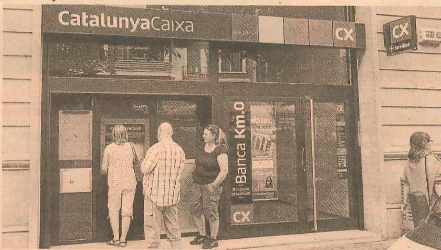
Sucursal de Catalunya Banc, que opera con la marca CatalunyaCaixa, que por ahora seguirá.

La integración de BBVA y Catalunya Banc implicará un recorte del 20% en la estructura combinada de ambas entidades en el mercado catalán. Hasta 2017 se prevé cerrar 285 oficinas de las dos redes comerciales y aplicar una reducción de plantilla de hasta 1.700 personas, de un total de 8.777 trabajadores. El nuevo consejero delegado de CatalunyaCaixa, Xavier Queralt, ha ratificado al actual equipo directivo, que ha reforzado con la incorporación de tres ejecutivos procedentes de BBVA para dirigir las zonas clave. P5