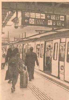
Metro de Barcelona.

Las puntocom de ocio Groupalia y Offerum firman su fusión P5